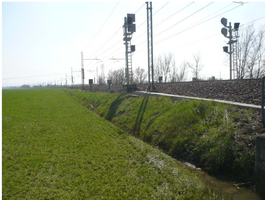
VISTA 2: Immagine dei binari ferroviari che delimitano tutta la proprietà sul lato sud, tratto compreso tra il Km 11+230 e il Km 11+530