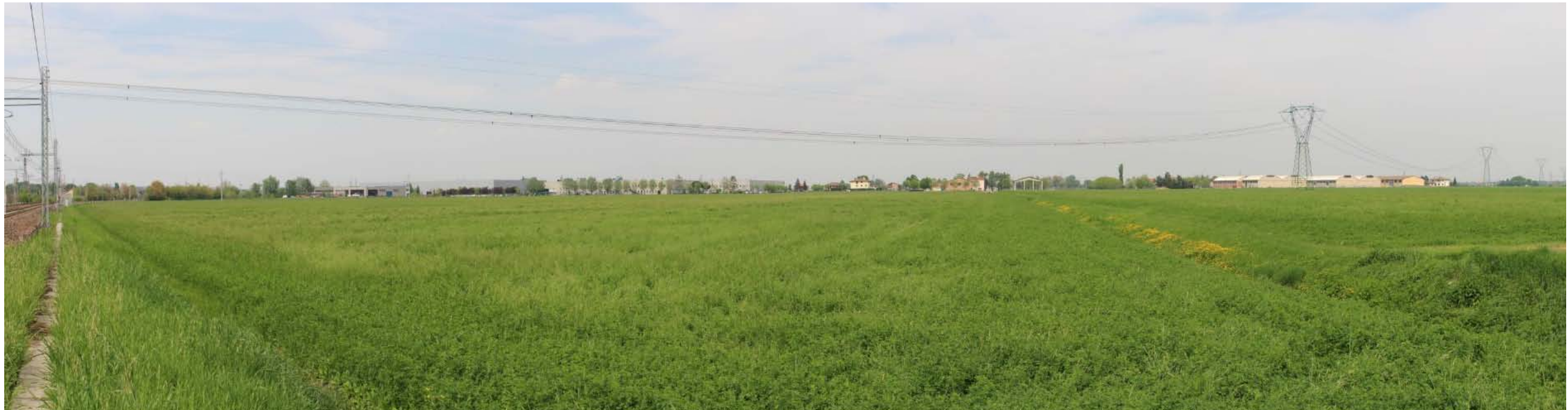
VISTA 1: Immagine dei binari ferroviari che delimitano tutta la proprietà sul lato sud, tratto compreso tra il Km 11+230 e il Km 11+530